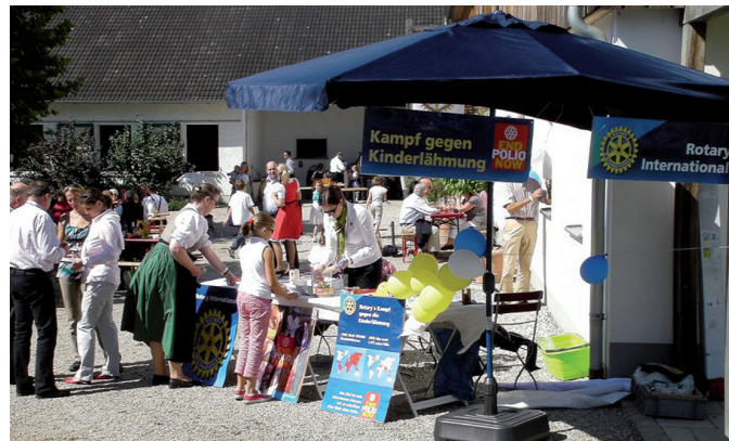
Infotisch beim Jazz-Brunch auf Gut Piesing

München-100, -Bavaria, -Blutenburg, -International, -Ost sowie die Rotaracter von München-International haben beim Jazzbrunch über Polio und die rotarische Kampagne informiert und Spenden gesammelt, mit denen ca. 1000 Kinder vollständig immunisiert werden können. Auch auf dem nächsten Neujahrsempfang sowie auf einer Wanderung sollen Spenden für END POLIO NOW eingeworben werden.