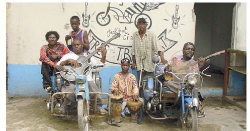
Staff Benda Bilili - Kultband aus dem Kongo

Aber auch ohne die Bezüge zur sozialen Wirk-